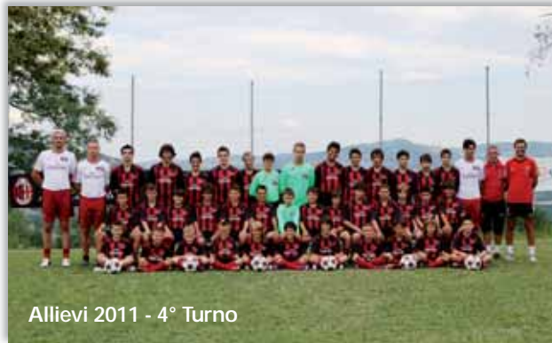
Allievi 2011 - 4° Turno