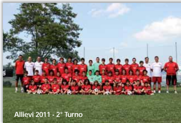
Allievi 2011 - 2° Turno