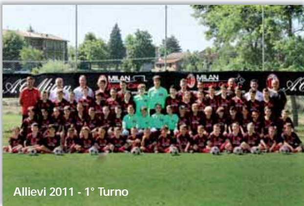
Allievi 2011 - 1° Turno