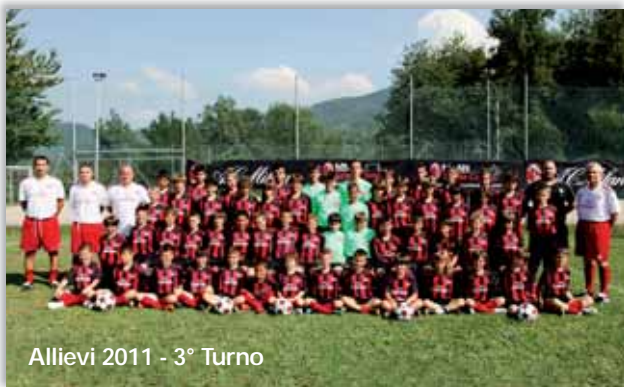
Allievi 2011 - 3° Turno